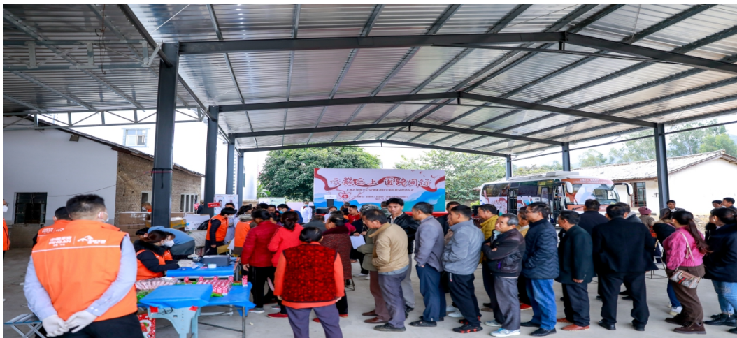
图：依托主发起行到弥勒举行“云巅之上，医路同行——公益健康项目”现场