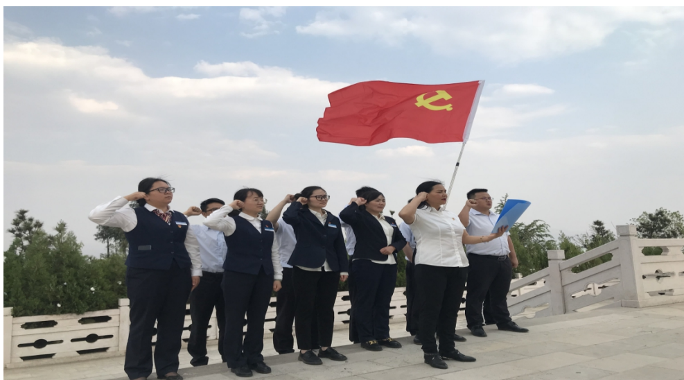
图：我行到弥勒人民英雄纪念碑开展“传承红色基因 发扬革命精神”党日活动

2021年4月1日，弥勒沪农商村镇银行全体党员、团员在党支部的组织下到弥勒人民英雄纪念碑开展“传承红色基因，发扬革命精神”主题党日活动。通过革命烈士的英雄事迹和精神，弥勒村行向员工传达了弘扬爱国主义、艰苦奋斗的精神和恪尽职守的素质，激励员工履行做好本职工作的实干精神。