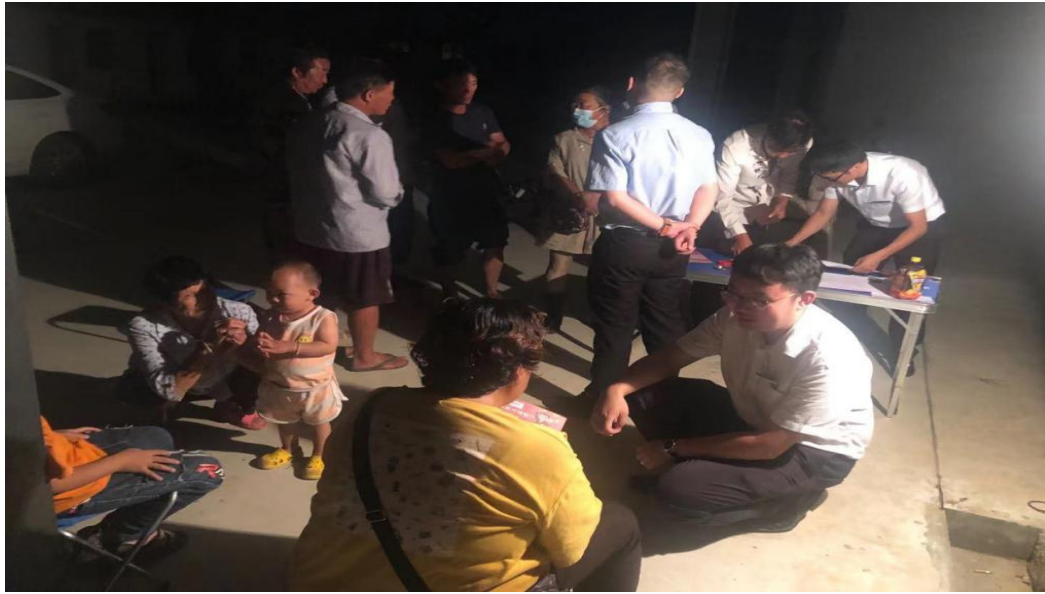
图：微小团队客户经理根据农户工作特点利用晚间进村整村授信

“及时雨”。每年秋收时节，弥勒村行关注农户最新动态，助力农民增收，构建符合“三农”金融需求的特色经营模式。截至2021年12月，弥勒村行已累计发放农户贷款2246笔，金额53444.9万元。