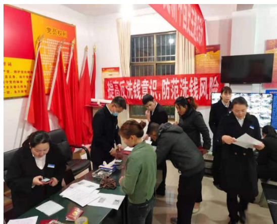
图 5：我行营业网点粘贴各类宣传海报