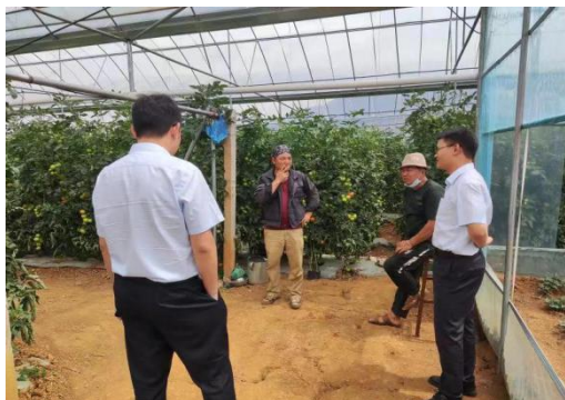
图 1：工作人员到番茄种植户走访