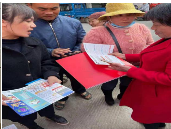
图 4：我行到柳园开展防范非法集资“普及金融知识守住‘钱袋子’”的宣传活动。