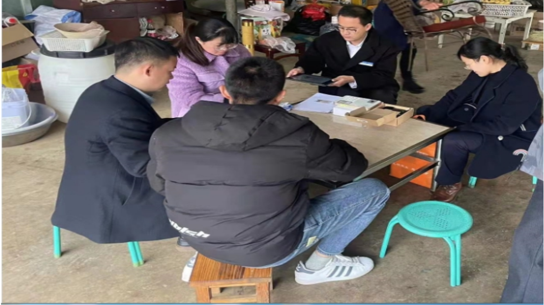
图：我行微小团队成员携带移动终端上门为客户现场办理业务