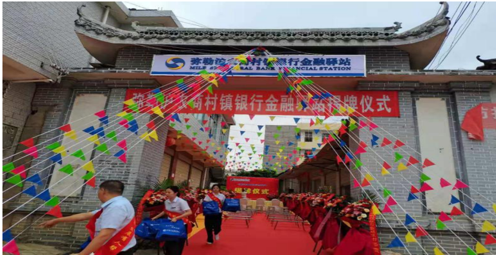
图：我行在朋普镇开设金融驿站

弥勒沪农商村镇银行号召行内员工积极农户和小微企业进行宣传，尤其是受疫情影响、急需贷款资金周转的个体或商户。对于符合准入条件的对象，弥勒村行第一时间介入调研，快速审查审批，通过及时授信帮助客户渡过难关。其次，弥勒村行利用“百行进万企”平台主动对接小微企业，加大授信。截至2021年12月，弥勒村行小微企业贷款较年初增加2227.64万元，小微企业贷款户数307户。