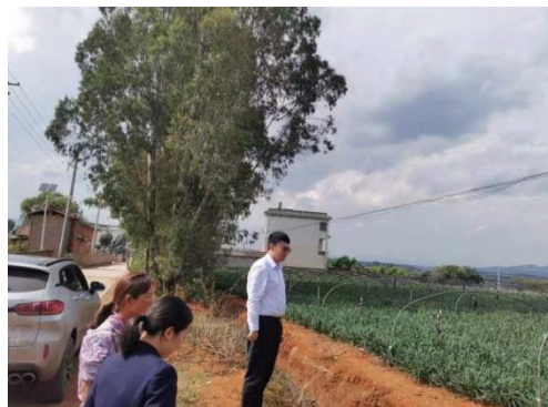
图 2：工作人员到韭黄种植户走访

弥勒沪农商村镇银行为有效解决服务半径较短的问题，延伸金融服务触角，员工携带便捷式移动终端开展外拓业务，推广便民、惠民、利民服务，为群众做实事。经前期宣传，居民纷纷集中到社区服务点提供信贷材料、咨询金融产品问题。有的居民还通过移动设备办理了储蓄卡，切实感受到村行的热心便民服务。