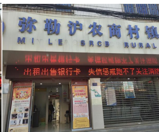
图 2：新哨支行 LED 宣传断卡行动标语