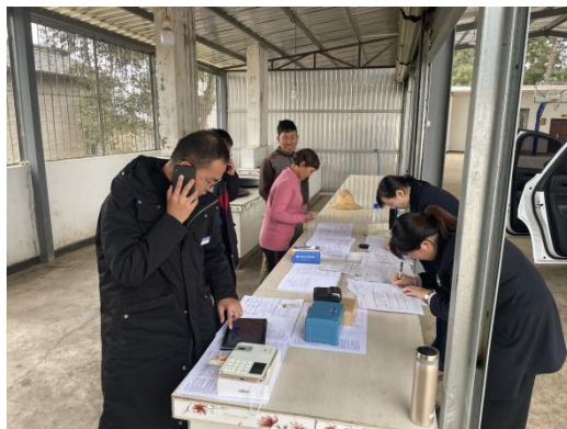
工作人员利用移动终端集中进社区开户

弥勒沪农商村镇银行为有效解决服务半径较短的问题，延伸金融服务触角，员工携带便捷式移动终端开展外拓业务，推广便民、惠民、利民服务，为群众做实事。经前期宣传，居民纷纷集中到社区服务点提供信贷材料、咨询金融产品问题。有的居民还通过移动设备办理了储蓄卡，切实感受到村行的热心便民服务。