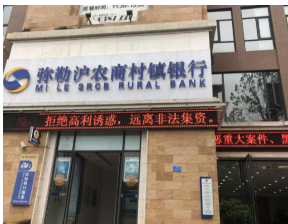
图 1：我行 LED 宣传非法集资

融秩序，密切警银协作机制，切实保护客户资金，保障消费者金融安全。弥勒村行于 2021 年组织全行开展“金融知识进万家”、“普及金融知识 守住‘钱袋子’”、“存款保险”、“支付清算”、“手机号支付”“反洗钱”、“电信诈骗”、“断卡行动”、“反假”等集中宣传月活动，依托营业厅、电子显示屏等场所和渠道，全面发动厅堂一线团队开展防电信诈骗等专题宣传。具体措施包括：印发“电信诈骗”“断卡行动”“反假”等主题宣传手册及折页，统一摆放在营业网点显要位置，并组织客户关注“弥勒沪农商村镇银行”微信公众号；悬挂警示标语、张贴防范提示等方式，对每一笔转账业务做到“四问一告知”，尤其是财务人员、老年客户等电信诈骗针对的重点人员开展防范电信知识宣传。